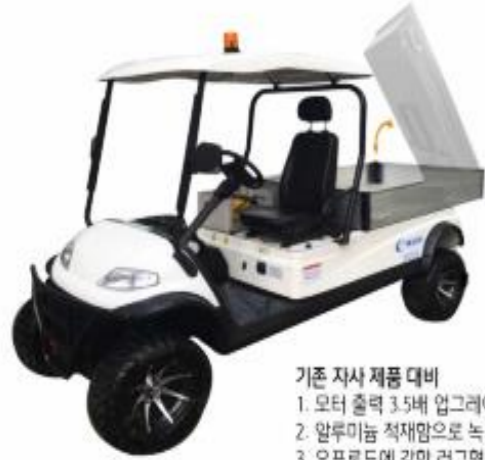
1인승 전동차 Model EK-L1

기본 자사 제품 대비 1. 모터 출력 3.5배 업그레이드 9.4마력 임 2. 알루미늄 적재함으로 녹 방지 3. 오프로드에 강한 러그형 타이어